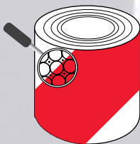
Class 2 Typ 2