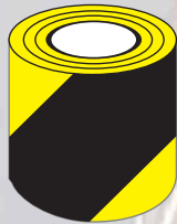
Class 1 Typ 1