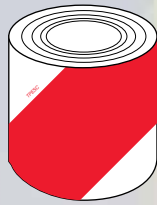
Class 1 Typ 1