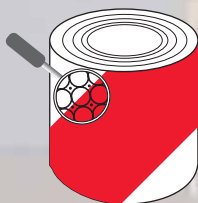
Class 2 Typ 2